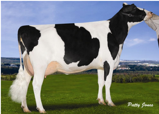
COMESTAR LAUTAMIRE PLANET